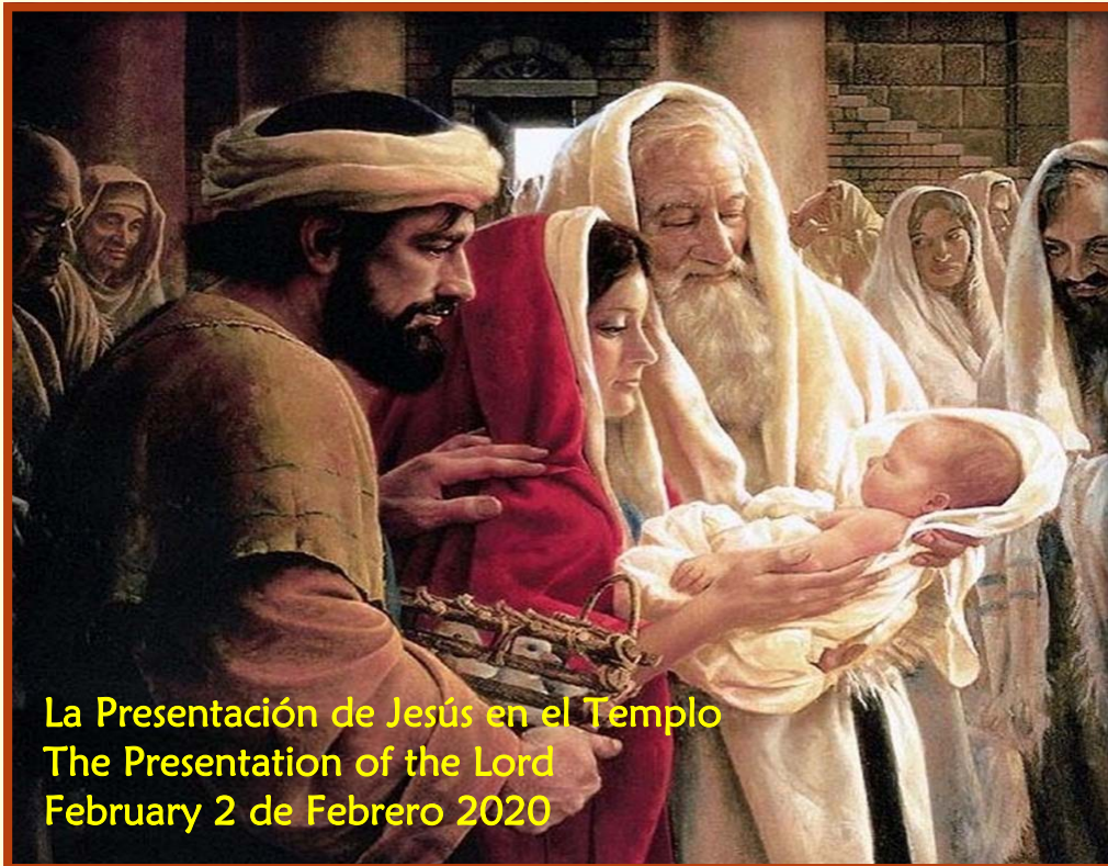
La Presentación de Jesús en el Templo The Presentation of the Lord February 2 de Febrero 2020